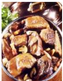
Coq au vin